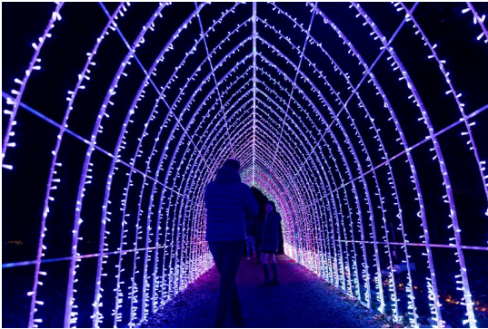
Trame di luce - installazione luminosa